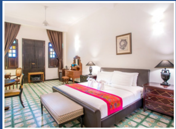
Heritage Room | 传承房 特大床 (King Bed) 2人入住 👤