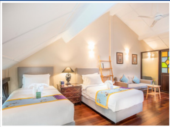
Heritage Loft | 阁楼房 双床 (Twin Beds) 2人入住 👤